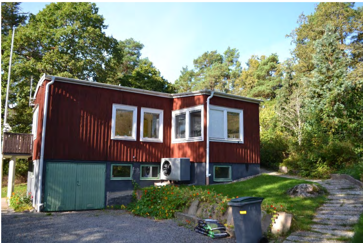
Höjdhagen 2018.

Höjdhagen är det tidigaste exemplet på de utbyggnadsområden som byggdes efter att KF tog över brukssamhället 1937 och utgör ett därmed ett av riksintressets uttryck. Byggnaderna är uppförda i en brytningstid, i en modern funktionalistisk utformning med inspiration av de tidigare bruksstugorna. De s.k. vinkelbodarnas karaktäristiska arkitektur har ett mycket högt kulturhistoriskt värde ur såväl ett lokalt som nationellt perspektiv.